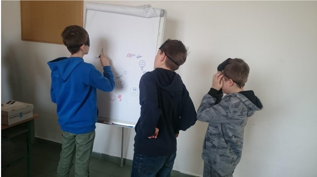
Hidak egymáshoz –szakmai konferencia